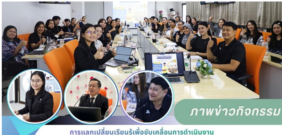
การแลกเปลี่ยนเรียนรู้เพื่อขับเคลื่อนการดำเนินงาน สู่การเป็น “องค์กรคุณธรรมและองค์กรแห่งความสุขที่มีคุณภาพ” “Integrity & Well-Being Connect: ร้อยเรียงคุณธรรม สร้างสุขทั่วองค์กร”